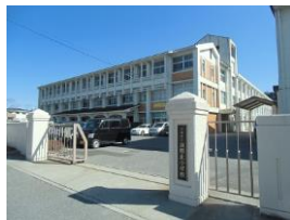
真野北小学校 徒歩1分 80m