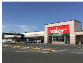
バロー真野店 徒歩30分 2400m