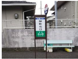
緑町北口バス停 徒歩2分 160m