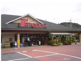
スーパーフレッシュみどり店 徒歩5分 400m