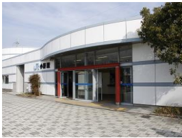
JR小野駅 バス7分 560m