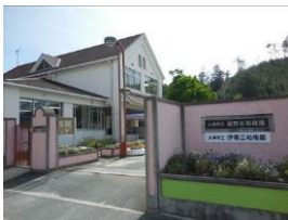
真野北幼稚園 徒歩1分 80m